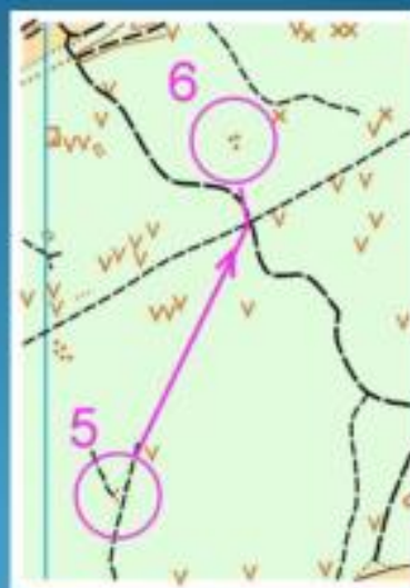
Рисунок 2. Бег в мешок

Автор педагог дополнительного образования Гридина Н.М.