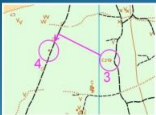
Рисунок 1. Бег с упреждением