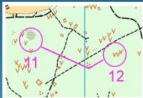
Рисунок 4. Параллельный заход